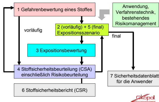
Abbildung 1: Schematisierter Prozess der Stoffsicherheitsbeurteilung